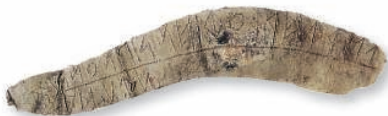
Lámina de plomo escrita en alfabeto ibérico

la Bastida parece tratarse de una lista de nombres propios seguidos de numerales rallados, lo cual se interpreta como un documento comercial de cuentas canceladas. Igual que las series de pesas y platos de balanza, todo nos habla de activos comerciantes conviviendo con los artesanos y campesinos en la misma ciudad.