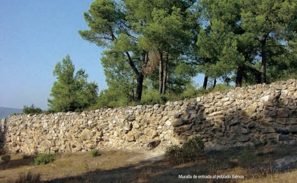
Muralla de entrada al poblado ibérico

un oppidum defensivo, en un centro económico donde materias primas y productos manufacturados indígenas se intercambiaban por objetos de prestigio importantes, tales como las cerámicas griegas.