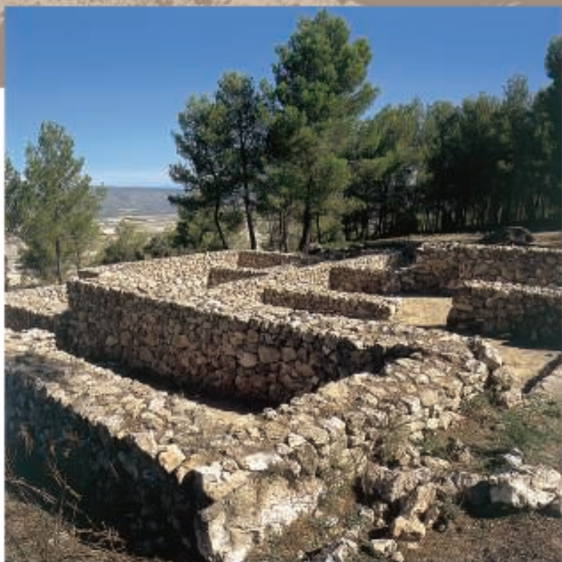
Estancias de las casas encontradas en la Bastida

En la actualidad, el Museo de Prehistoria ha retomado la línea de investigación en La Bastida con un amplio proyecto de excavaciones, restauración y difusión del yacimiento con el fin de mostrar a todos los visitantes la importancia del patrimonio arqueológico de Moixent, y al mismo tiempo, la posibilidad de descubrir, conocer, e incluso reproducir como vivían nuestros antepasados, los íberos. En los nuevos estudios se han identificado conjuntos de edificaciones de posible función sacra o palaciega.